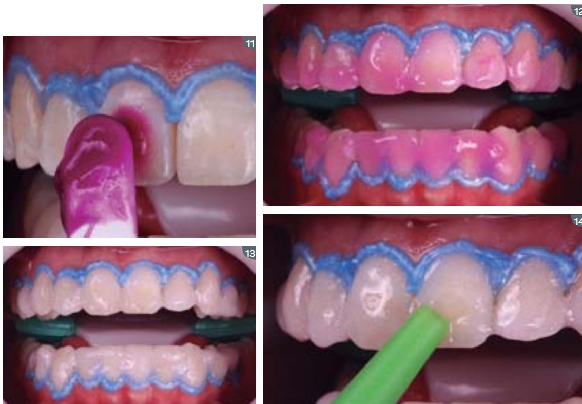
11 to 14. The gel should be applied in a thin layer in order to cover the frontal surface of the teeth. Throughout the application process, the gel changes its color (from red to colorless) indicating the progress of the chemical reaction. The gel should remain on the teeth for 15 minutes, after that, it should be removed by suction. In a single session, it is suggested to apply the gel 3 times of 15 minutes each.

9 y 10. Preparo del gel blanqueador Whiteness HP, mezclando peróxido y espesante en la proporción 3 por 1. La mezcla debe ser homogeneizada durante 40 segundos para obtención de la viscosidad adecuada del gel para aplicación.