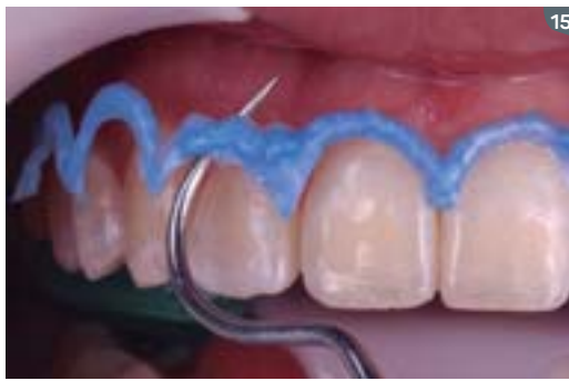
15. After complete removal of the gel by suction and air/water jets, Top dam is fully removed.

15. Luego de la remoción completa del gel por succión y chorros de aire/agua, se remueve el Top dam.