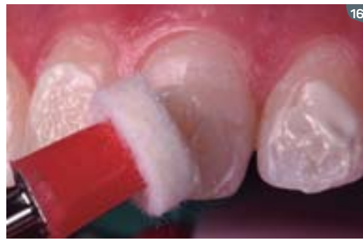
16. To conclude the session, polishing with Diamond Excel diamond paste and Diamond felt disks is performed.

15. Luego de la remoción completa del gel por succión y chorros de aire/agua, se remueve el Top dam.