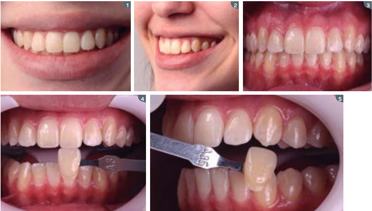
1 to 3. Initial photos of the smile and intraoral. 4 to 5. Shade taking with the VITA shade guide. Shade similar to A3 for incisors and A3.5 for canines.