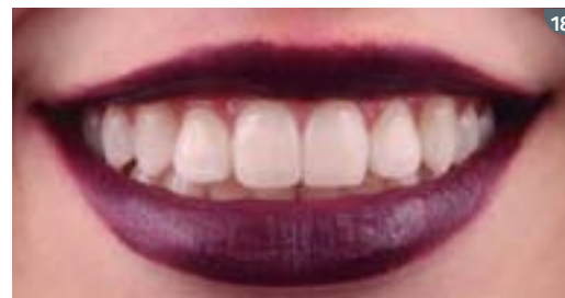
17 to 19. Final result after 3 sessions, showing shade similar to OM3 (lighter than B1).

17 a 19. Resultado final luego de 3 sesiones, mostrando color de los dientes similar a OM3 (más claro que B1).