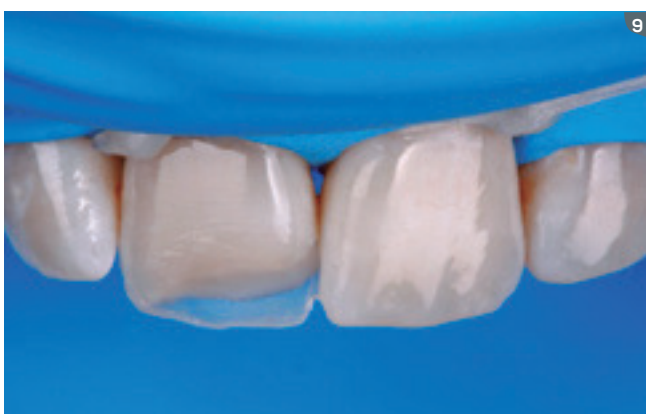
9 and 10. In the second, third and fourth layers of the restoration we used the dentin shade DA1 (Opallis) in order to reproduce the mamelons and leaving space for the translucent edge.