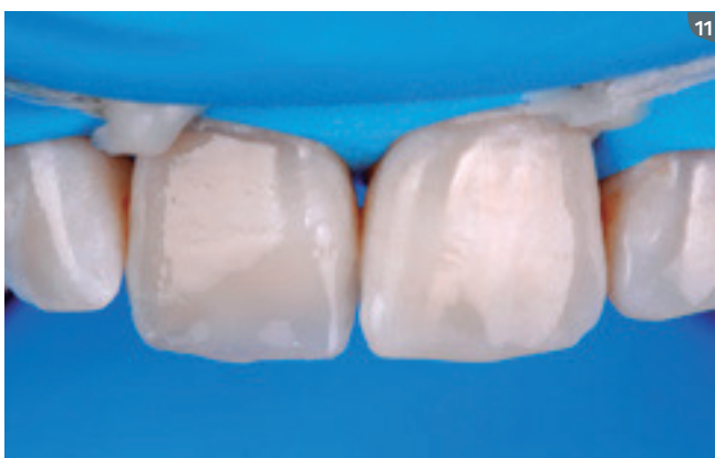
11. Reproduction of translucent edge with the translucent shade T-Blue (Opallis). 11. Reproducción de la borda translúcida con el color translúcido T-Blue (Opallis).