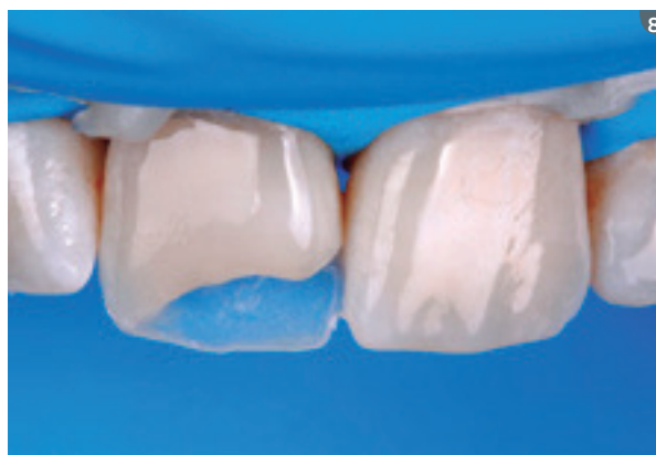
8. Beginning of stratification by making the palatine layer, which will always be in enamel, at all times. In this case we used enamel shade EA1 (Opallis). 8. Inicio de la estratificación con la confección de la capa palatina, que siempre será en esmalte. En este caso usamos el esmalte EA1 (Opallis).