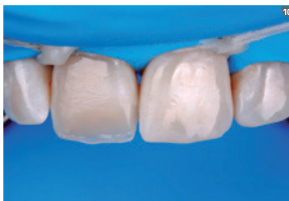
9 y 10. En la segunda, tercera y cuarta capas de la restauración usamos el color de dentina DA1 (Opallis) reproduciendo los mamelones y dejando espacio para la borda translúcida.