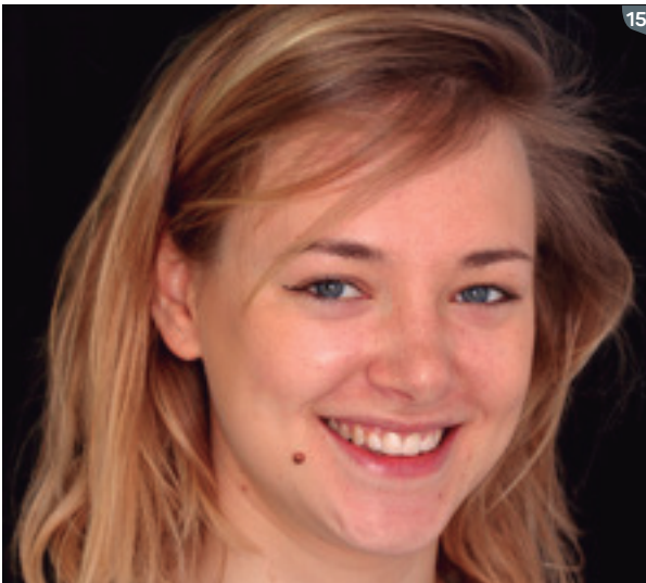
15. Final face photograph.