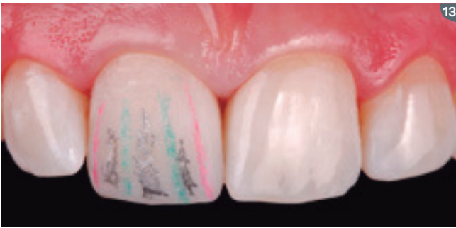
13. For finishing and polishing, we used Diamond Pro disks with the assistance of anatomical lines, polishing rubber and felt disks combined with the Diamond polishing paste.

13. Para el acabado y pulido de la restauración, usamos los discos Diamond Pro con el auxilio de las líneas anatómicas, gomas de pulido y discos de fieltro con la pasta de pulido Diamond.