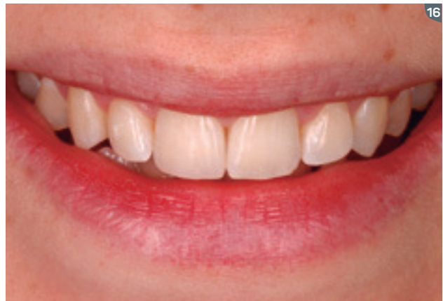
16. Final smile.