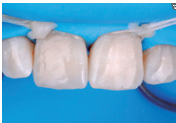
12. Finally, we finished stratification with the enamel layer with shade EA1 (Opallis), reproducing the primary anatomy of the right central incisor. 12. Finalmente terminamos la estratificación con la capa de esmalte EA1 (Opallis), reproduciendo la anatomía primaria del incisivo central derecho.