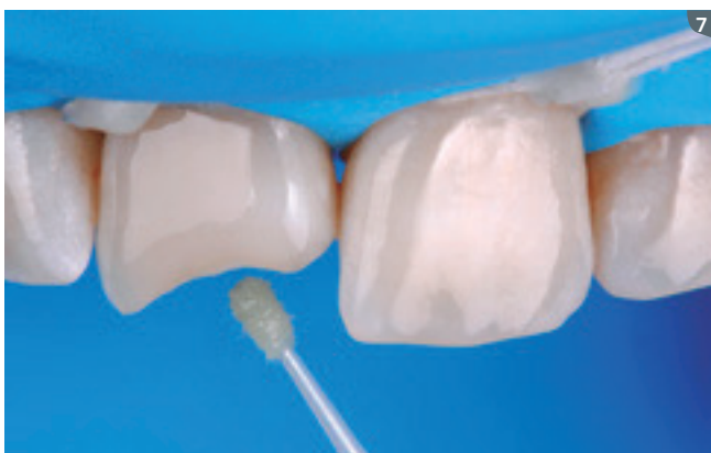
7. Adhesive application (Ambar) and subsequent light curing for 10 seconds. 7. Aplicación del adhesivo (Ambar) y posterior fotocurado por 10 segundos.