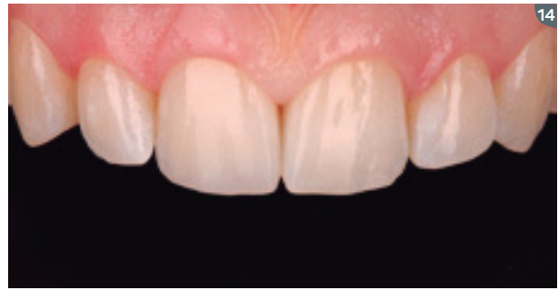
14. Final intraoral result.

13. Para el acabado y pulido de la restauración, usamos los discos Diamond Pro con el auxilio de las líneas anatómicas, gomas de pulido y discos de fieltro con la pasta de pulido Diamond.