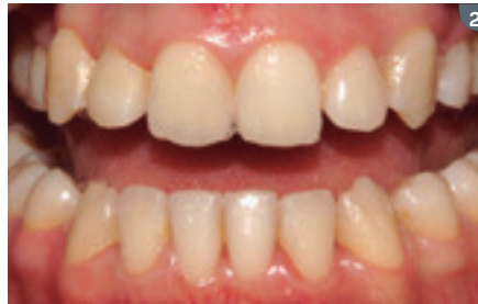
2. Intra-oral initial image. 2. Imagen intraoral inicial.