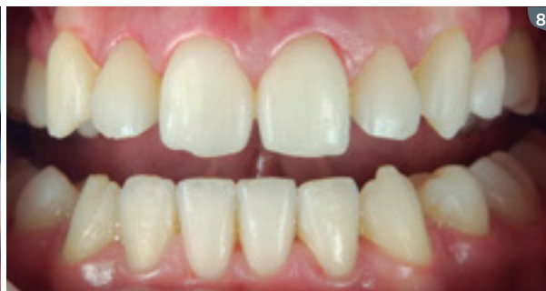
8. Post-whitening look. 8. Aspecto luego de blanqueamiento.

7. El blanqueamiento se realizó utilizando la técnica mixta: 1 aplicación con Whiteness HP Maxx en el consultorio durante 45 minutos y 25 días de blanqueamiento casero con Whiteness Perfect 10%.