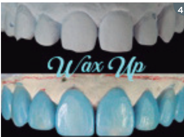
4. Waxing according to the measurements obtained in the digital drawing. 4. Enceramiento del caso de acuerdo con las medidas obtenidas en el diseño digital.

3. El planeamiento mediante el CSD consigue alta previsibilidad en los tratamientos estéticos, puesto que nos evidencia el conflicto estético y funcional del paciente, nos direcciona al abordaje oclusal a seguir.