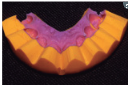
5. Molding of the waxing for making the mock-up. 5. Moldeo del enceramiento para confección del mock-up.