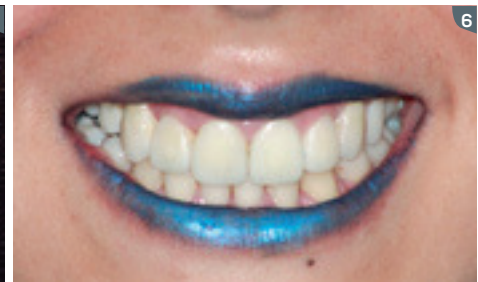
6. Mock-up: restoration test to obtain the patient's final corroboration, decide on fine tuning details of the form, size and texture.

6. Mock-up: el ensayo restaurador para corroborar aceptación final del paciente, ultimar algunos detalles mínimos de forma, tamaño y textura.