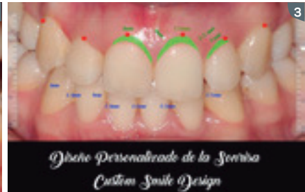
3. Planning according to the CSD achieves high predictability in the aesthetic treatments, since it gives evidence to the aesthetic and functional conflict of the patient and directs the professionals to the occlusal approach to follow.

3. El planeamiento mediante el CSD consigue alta previsibilidad en los tratamientos estéticos, puesto que nos evidencia el conflicto estético y funcional del paciente, nos direcciona al abordaje oclusal a seguir.