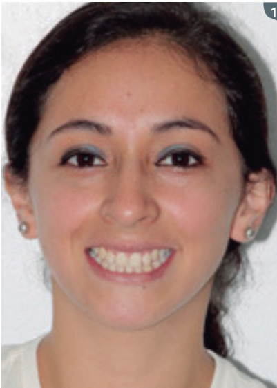
1. Patient's initial picture. 1. Foto inicial de la paciente.